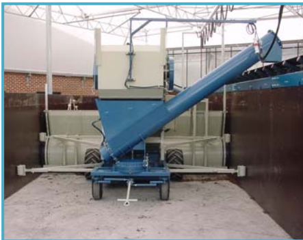
vooraanzicht vue de face