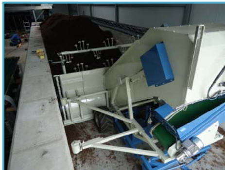
transportband voor uitstort déversement par convoyeur