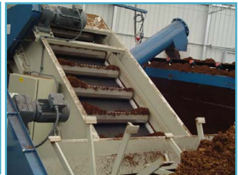
opvoerband met meenemers convoyeur élévateur avec traverses

grondopvoerwagens / élévateurs de terreau