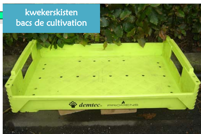
kwekerskisten bacs de cultivation