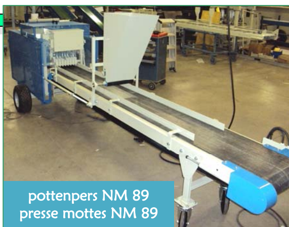
pottenpers NM 89 presse mottes NM 89