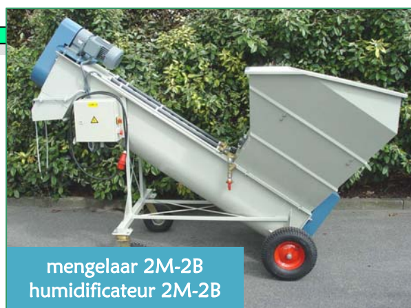
mengelaar 2M-2B humidificateur 2M-2B