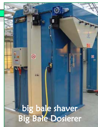
big bale shaver Big Bale Dosierer