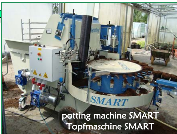
potting machine SMART Topfmaschine SMART