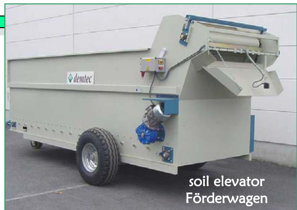
soil elevator Förderwagen