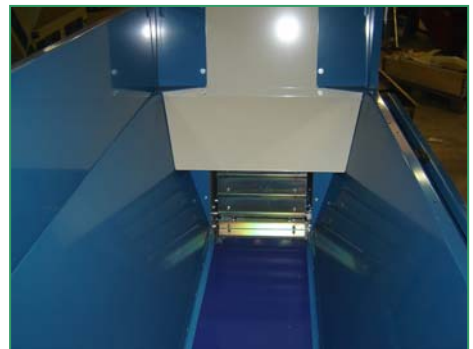
filling grid with vibrator Füllraster mit Triller