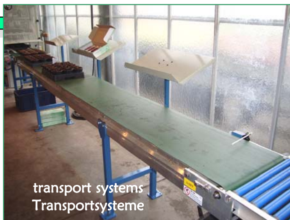
transport systems Transportsysteme